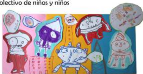
Trabajo colectivo de niñas y niños