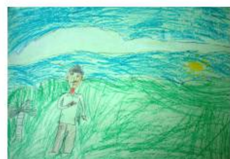
Trabajo colectivo de niñas y niños