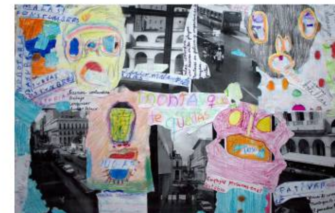
Costumbres Trabajo colectivo niños de 11 años