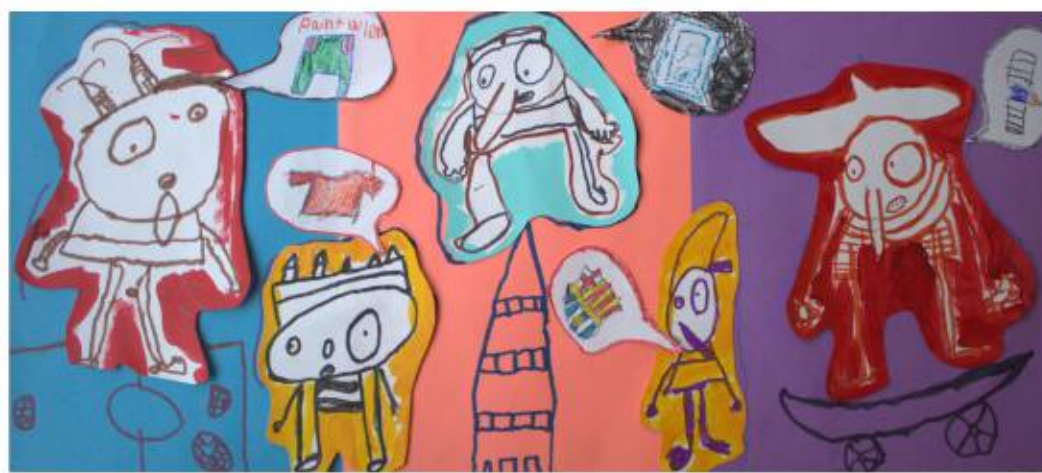
Trabajo colectivo de niñas y niños