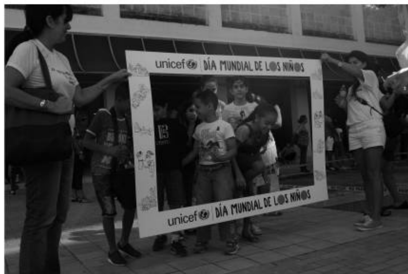
Patio del Museo, jornada por la Convención de los Derechos de los Niños