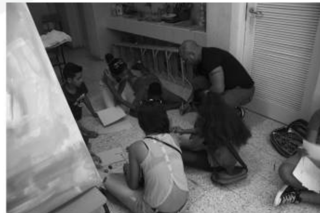
Participantes del taller interactuando con el artista Alexander Mayet