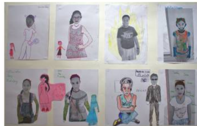
Trabajo colectivo niños de 10 años