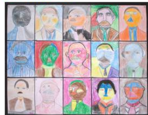
Trabajo Colectivo niños y niñas de 8 años. Inspirado en la obra de Raúl Martínez.