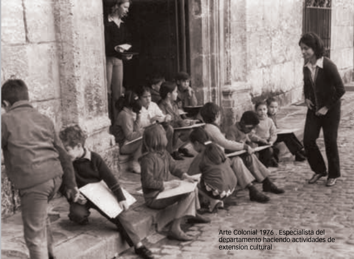
Arte Colonial 1976 . Especialista del departamento haciendo actividades de extension cultural