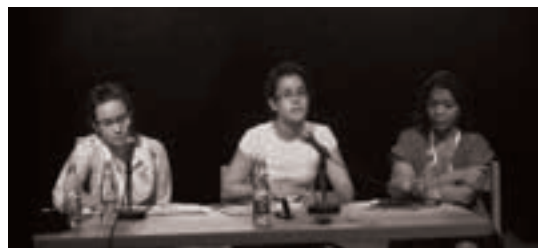
Ponencia del Departamento de Servicios Educativos en la primera Bienal de Talleres Comunitarios