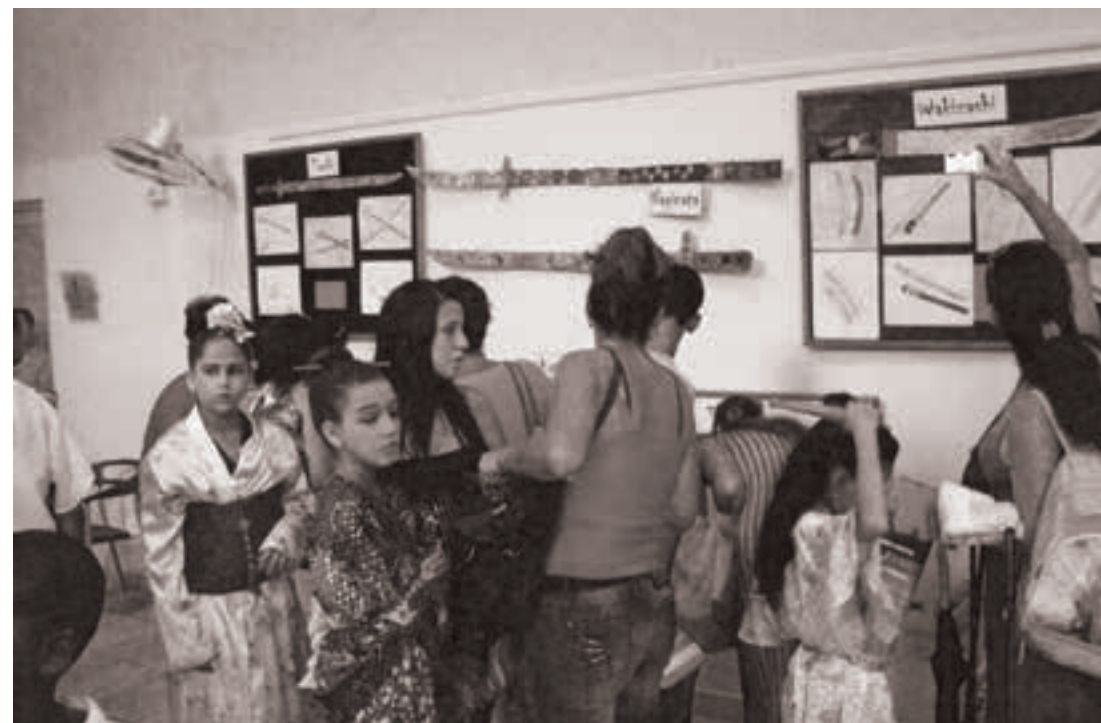
Taller Nuevamente un samurái en La Habana , 2014. Dedicado al 400 aniversario de la llegada del primer Samurai a la Habana