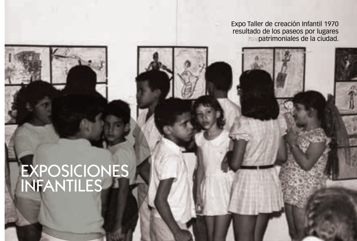
Expo Taller de creación Infantil 1970 resultado de los paseos por lugares patrimoniales de la ciudad.

En el importante encuentro quedó demostrado que la voluntad, el desarrollo y transparencia de las políticas públicas contribuyen a la creación de proyectos que a pesar de los obstáculos llegan a buen fin pues los mueve el espíritu humanista y el deseo de que la comunidad eleve su nivel de apreciación de sus valores y los de su entorno. Los proyectos son transformadores de conductas sociales en los jóvenes y en sus familias y los museos son espacios de socialización, aprendizaje, y entretenimiento para sus integrantes.