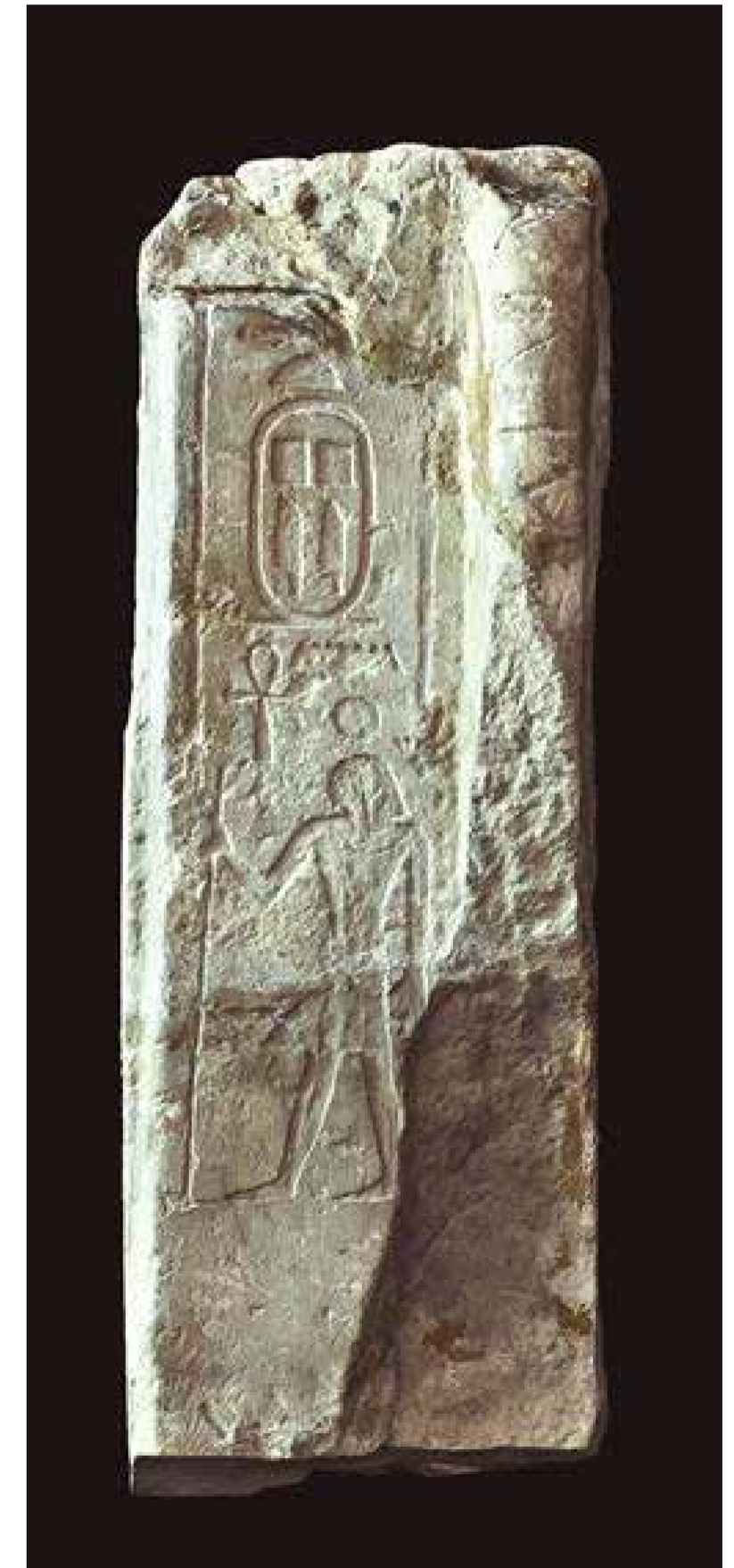
Fragmento de falsa puerta a nombre de Pepy Anj