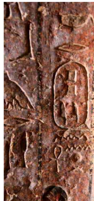
Inscripción de los relieves de la tumba de Pepy Anj

valor por su significado, ya que es muestra sui géneris de un momento histórico egipcio (Dinastías V y VI) donde la estructura del poder faraónico perdió relevancia y funcionarios locales se sienten investidos de gran poder mostrando en sus atributos los símbolos reales, este periodo es comparado por algunos estudiosos con el Feudalismo Europeo. Esta situación culmina con la centralización del poder faraónico en Tebas con la dinastía XI, lo cual da comienzo al llamado Imperio Medio. Igualmente es de destacar que la tumba de procedencia de este relieve es considerada una de las más importantes del Imperio Antiguo, por su gran tamaño, factura y porque la decoración de sus paredes muestra las escenas de procesión funerarias más completa del período.