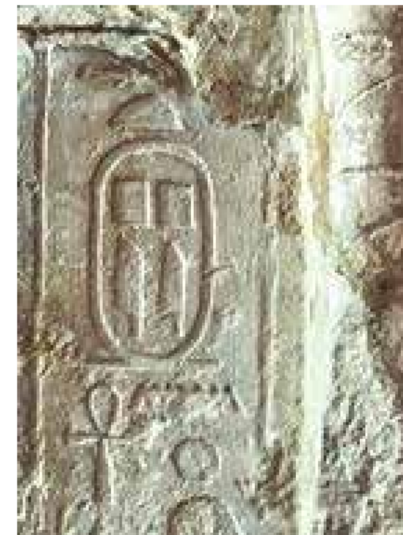
Relieve del MNBA