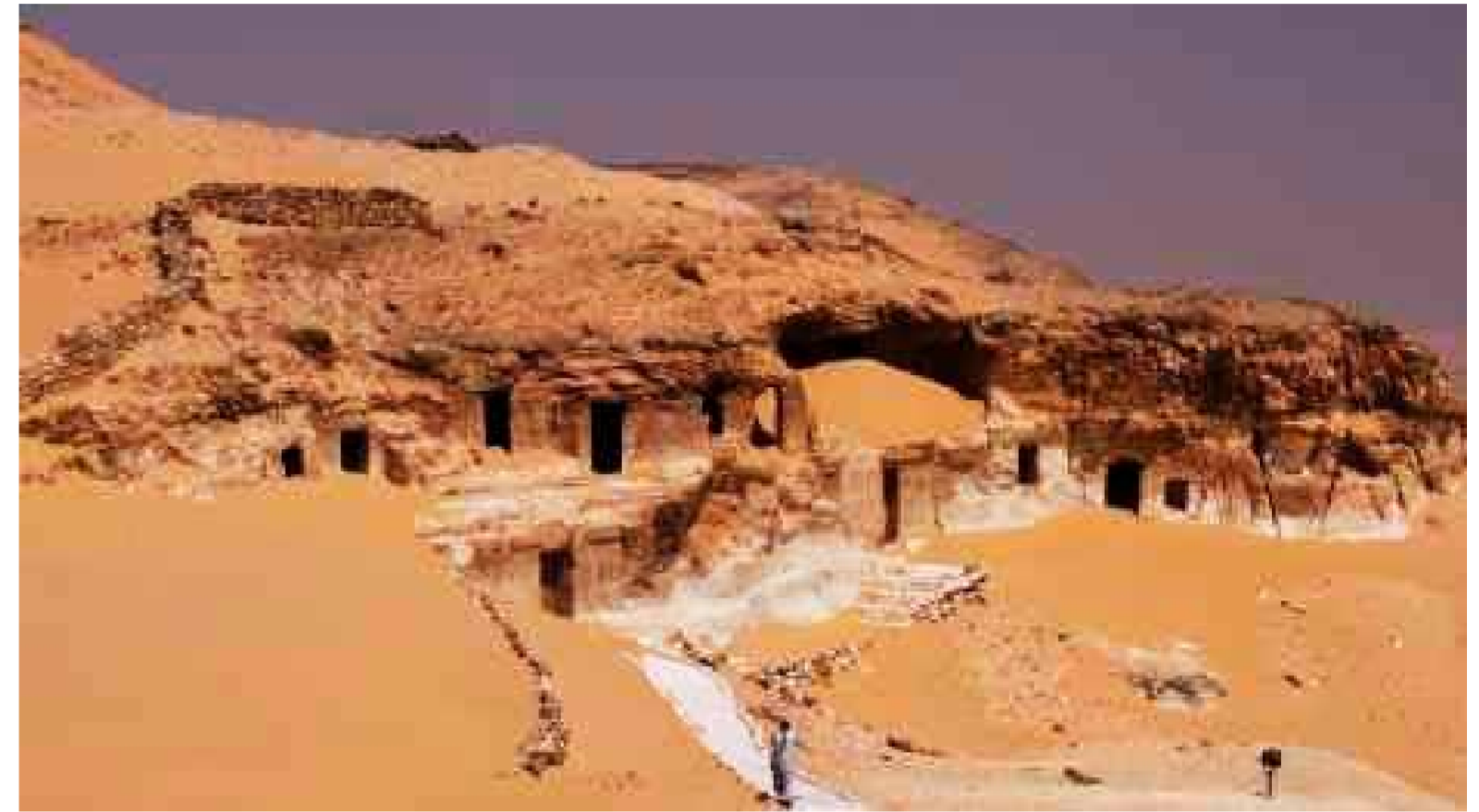
Tumbas A1 y A2 de Mier