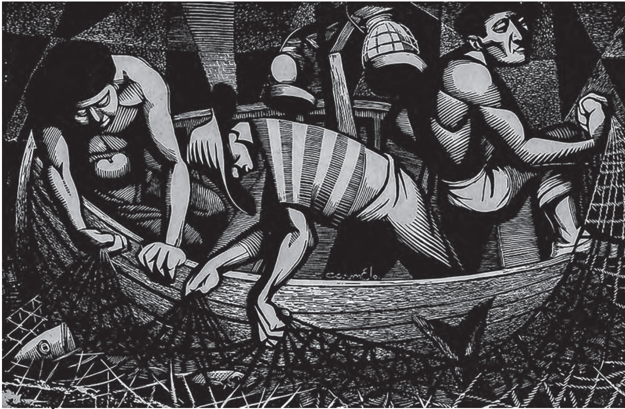
A la izquierda, Pescadores de Vigo, grabado; Frustración (1951), e Ismos (1953), ambas pintura.

ducción gráfica fue consecuente con el recuento épico de estos acontecimientos, y junto a un grupo de grabadores solidarizados con el mismo proceso, concibe en 1960 la edición de una carpeta de grabados en apoyo a la Primera Declaración de La Habana.