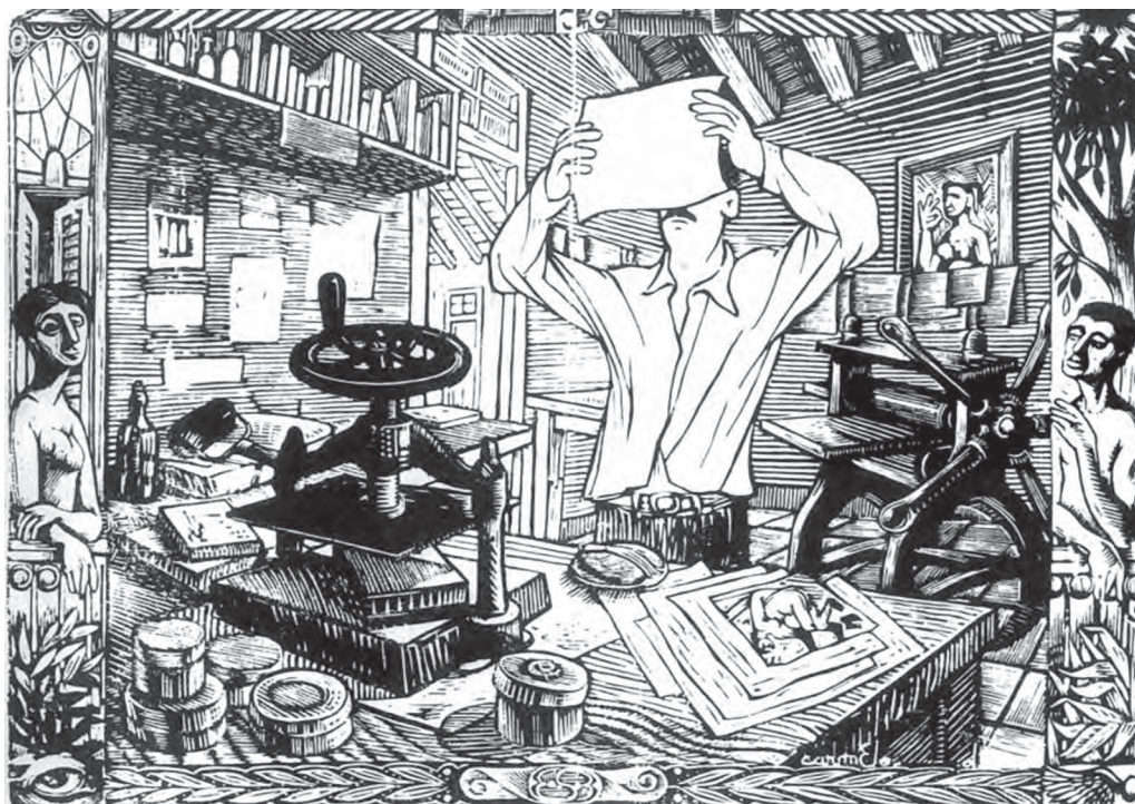
El Taller del grabador (o El grabador), grabado (1954).

vacación en sus propuestas creativas. En las dos décadas anteriores, varios de nuestros creadores 3 se habían inscrito en ella, muy atractiva, por demás, desde el punto de vista del ambiente cultural y artístico, que sustituía el acostumbrado y provechoso viaje de completamiento de estudios a algunos centros pre-establecidos (Madrid y París, fundamentalmente) de una Europa en dilatada recuperación posbélica.