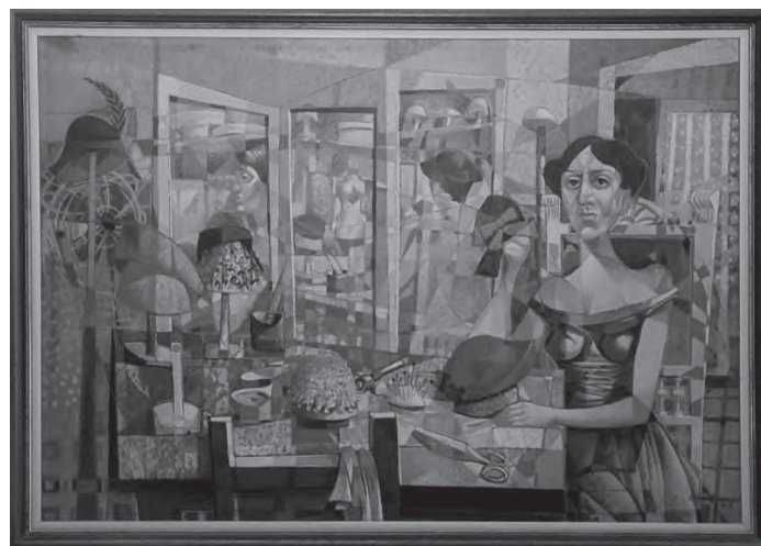
La sombrerera (1958), y Simbolismo (1945), ambas pintura.

Su labor promocional práctica radicó esencialmente en la dirección y conducción de la AGC, la cual tenía entre sus propósitos visualizar el desarrollo del arte incisivo en Cuba. Para ello se sirvió de la organización de exposiciones de miembros de esa agrupación —colectivas e individuales— y, a la vez, valoró las dimensiones del catálogo, de las palabras de apertura de esas muestras, así como de su repercusión en publicaciones periódicas nacionales y extranjeras, que contuvieran va-