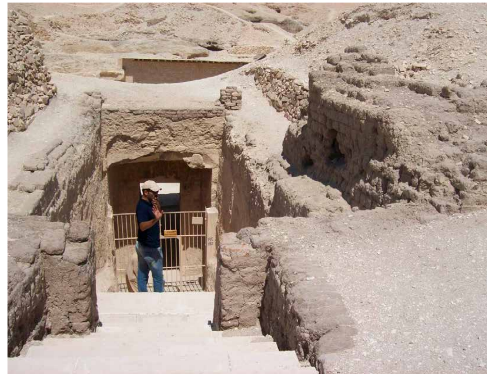
Entrada a la tumba KV192

La tumba de Kheruef es la mayor de Tebas, fue construida durante la XVIII dinastía y tiene la estructura típica del Imperio Nuevo, con una entrada pequeña, desde la cual se accede a un corredor por debajo de la superficie unos cuantos metros. A diferencia de otras, tiene la entrada principal por el este, debido a las condiciones topográficas, por lo cual la tumba hace un eje de este a oeste. No solo este aspecto la hace poco común respecto a sus contemporáneas, sino que el tema de su decoración es diferente, ya que no trata de temas de índole funerario, como son las escenas de cortejo, embalsamamiento, pesaje del corazón, Campos de lalú, etc.; sino que presenta escenas de los Jubileos del monarca, donde el difunto, Kheruef, tuvo un rol destacado.