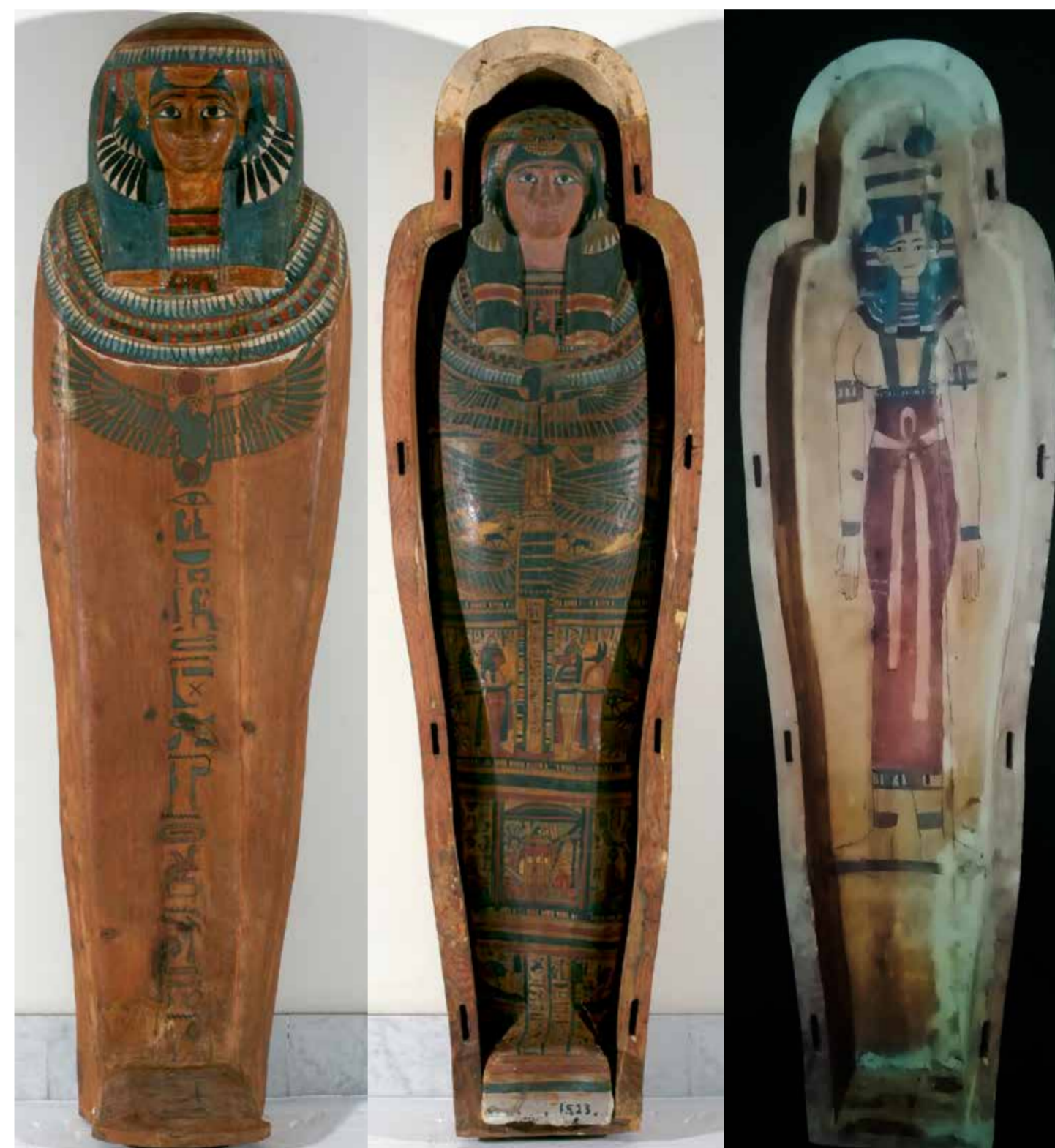
Imagen No.1 (Sarcófago) Sarcófago de la tumba de un Alcalde de Tebas Tercer período intermedio, XXII - XIII dinastía, 944-716 a.n.e. Madera estucada y policromada. Encartonado; 81 x 51 cm