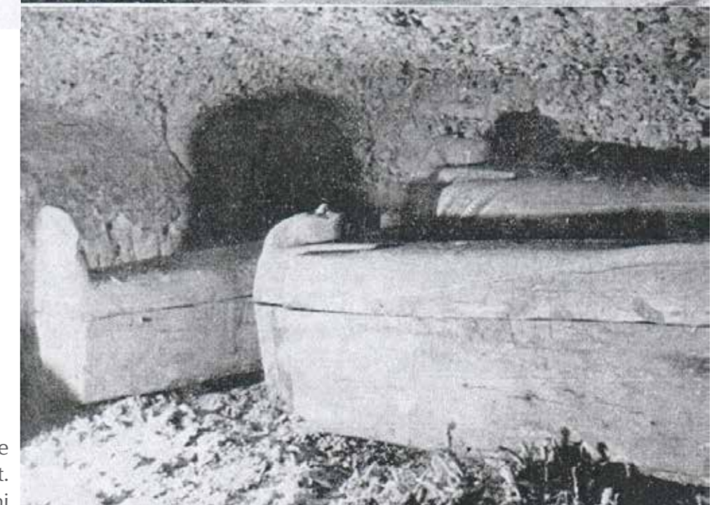
Imágenes de la cámara donde se encontró Tachebet.