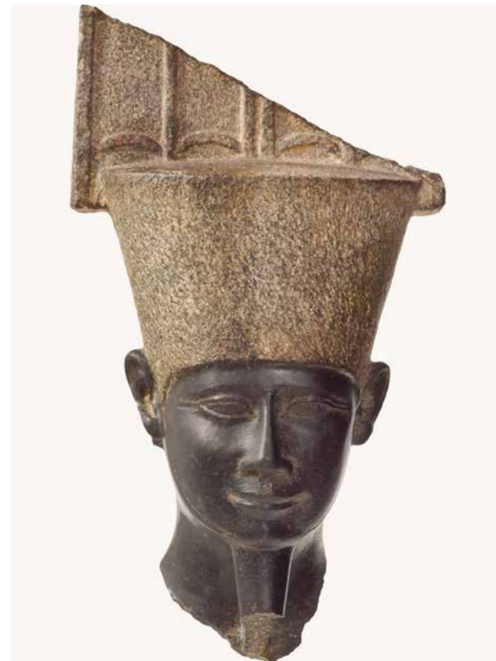
Anónimo Cabeza de una estatua del dios Amón Imperio Nuevo, XX Dinastía Basalto negro; 19.5 x 12 x 12 cm Colección Condes de Lagunillas

El dios en esta obra presenta una faz placentera, acentuada por las líneas curvas en el óvalo de la cara, sus ojos son almendrados y la boca de labios finos esboza una sonrisa. El tocado consiste en una corona cilíndrica en forma de casco, que es la corona roja del Bajo Egipto con dos altas plumas sobre la misma. Este es el típico tocado llamado Shuty que es característico en la iconografía de Amón. Además, porta una barba postiza. Hoy día, las plumas en su parte superior, como la barba aparecen mutilados.