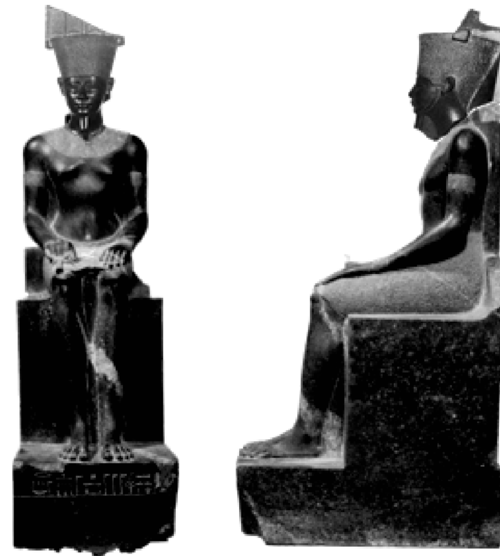
La cabeza y el cuerpo unidos digitalmente

La culminación de esta investigación nos dio una nueva lectura de la obra, acentuando su valor patrimonial y con la unión digital de la misma se puede brindar una información que resulta sugestiva al público visitante. Anhelamos que en un futuro podamos unir ambos fragmentos en exposiciones tanto en Cuba como en Francia.