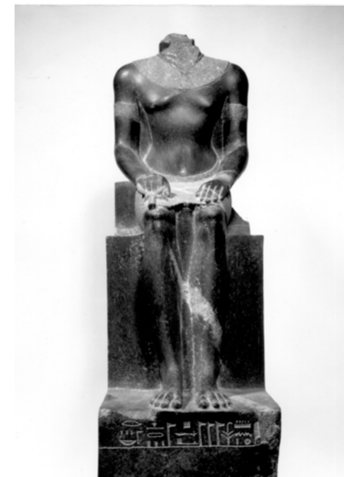
Cuerpo de una estatua de Amón Basalto negro; 33.5 x 14.5 x 33.5cm Museo del Louvre