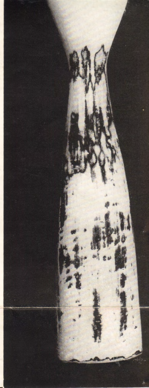
Cerámica por Arcay.