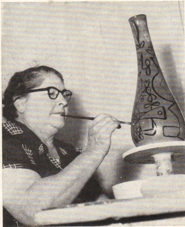
La pintora Amelia Peláez, decorando una cerámica.