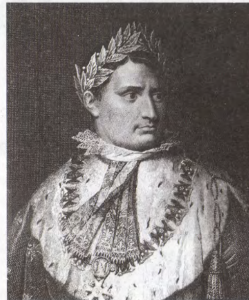
Stefano Tofanelli / Napoleon Buonaparte (Detalle)

El siglo XIX nace bajo el signo del cambio: las revoluciones burguesas de 1830 y 1848 contra el antiguo régimen, el surgimiento del proletariado industrial y las utopías sociales, el desarrollo de la máquina de vapor, las comunicaciones y la producción masiva. El arte documentará el nacimiento de la pequeña burguesía como cliente de la producción artística, los diversos movimientos estéticos -romanticismo, realismo, naturalismo, impresionismo y postimpresionismo-, y el grabado será integrado a las nuevas coordenadas de la institución arte.