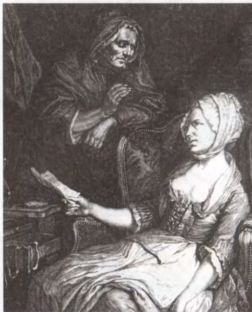
Louis Lempereur / La mare indulgente (Detalle)

Un capítulo importante del siglo XVIII e inicios del XIX es expuesto a través de los grabados franceses creados bajo el influjo de la era napoleónica. Escenas de batallas, la glorificación heroica del Gran Corso, el registro detallado del vestuario y armamentos de las tropas imperiales, vistas de París y otras ciudades engalanadas en festividades son algunos de los motivos iconográficos presentes en esta peculiar serie.