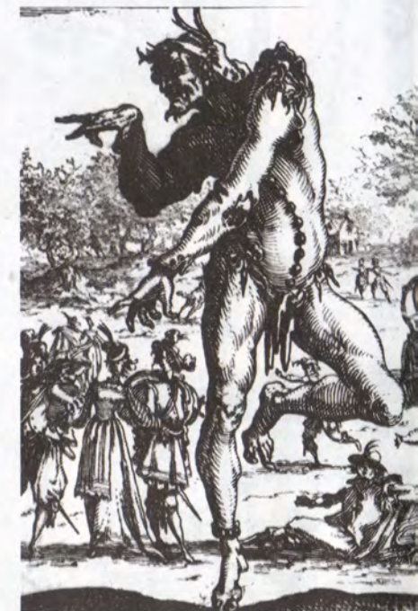
Jacques Callot / Sátiros (Detalle)